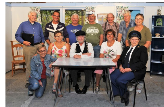
De vrolijke spelers uit Steenberg